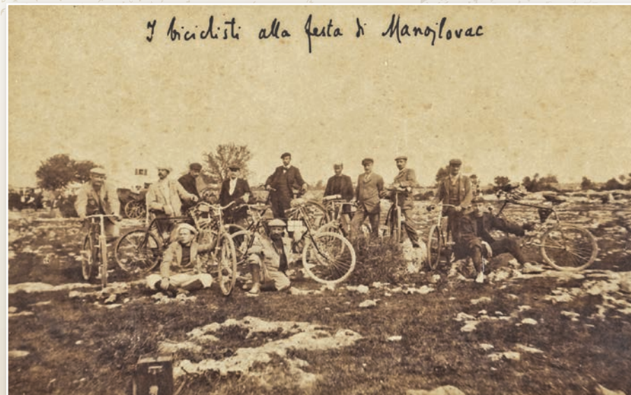
Biciklisti prilikom otkrivanja spomen-ploče u povodu posjeta cara Franje Josipa I. 1875 g. (Manojlovac, 1899. g.)

Biciklizam se razvijao vrlo dobro nakon Prvoga svjetskog rata zahvaljujući čuvenoj talijanskoj strasti prema tome sportu. Njegovi nositelji pretežno su bili Arbanasi. Godine 1919. Veloce Club Zaratino u suradnji s klubovima Ginnastica Zara i Circolo Canottieri Diadora organizirao je priredbu Fiore Italico , u sklopu koje su održane i tri biciklističke utrke na 18 kilometara.