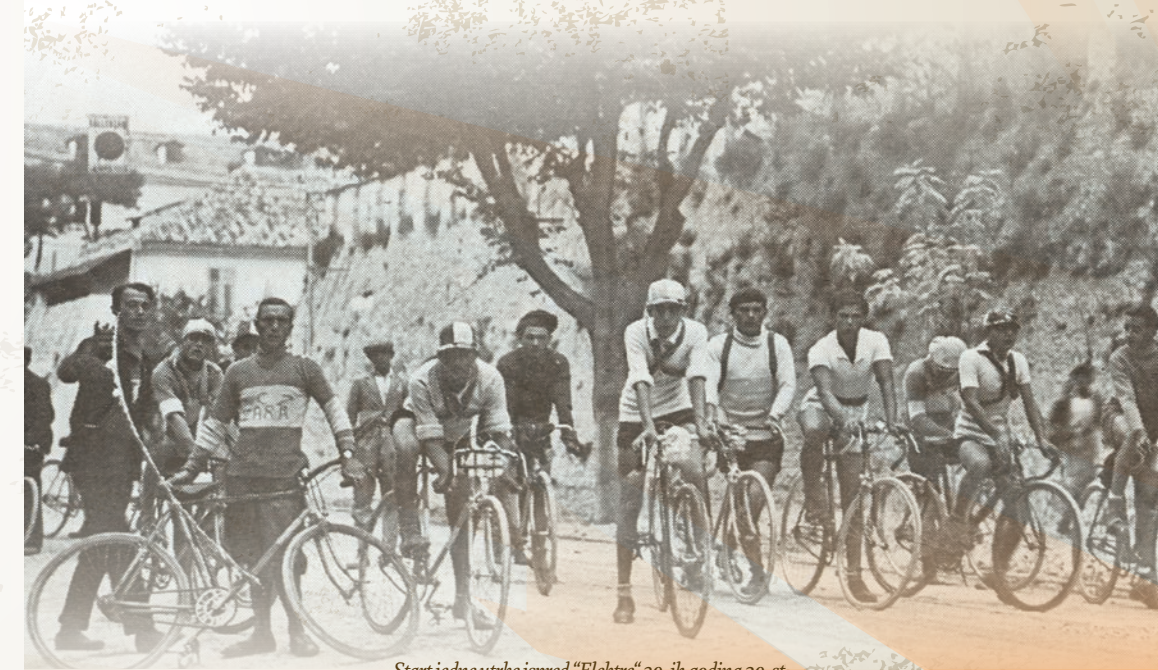
Start jedne utrke ispred „Elektre“ 30-ih godina 20. st.

Izložba u povodu Međunarodnog dana arhiva