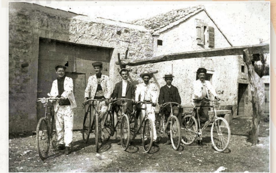
Grupa muškaraca