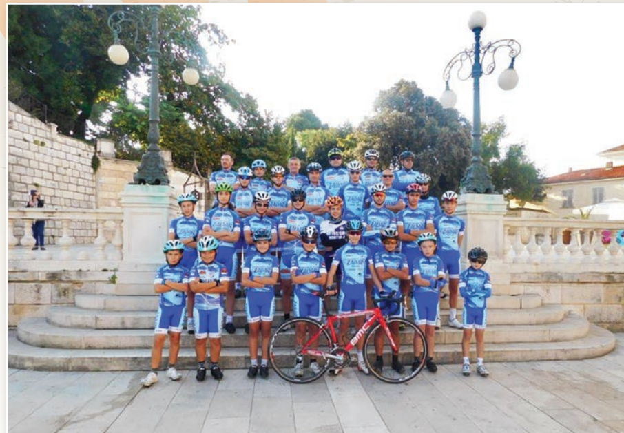
Članovi biciklističkog kluba Zadar pred biciklijadu Zadar-Paklenica, 20. 10. 2018.

U razdoblju od 1966. do 1976. godine došlo je do krize i klub je djelovao samo formalno. Od 1. ožujka 1976. počeo je ponovno djelovati. U novoj generaciji biciklista isticao se dvostruki