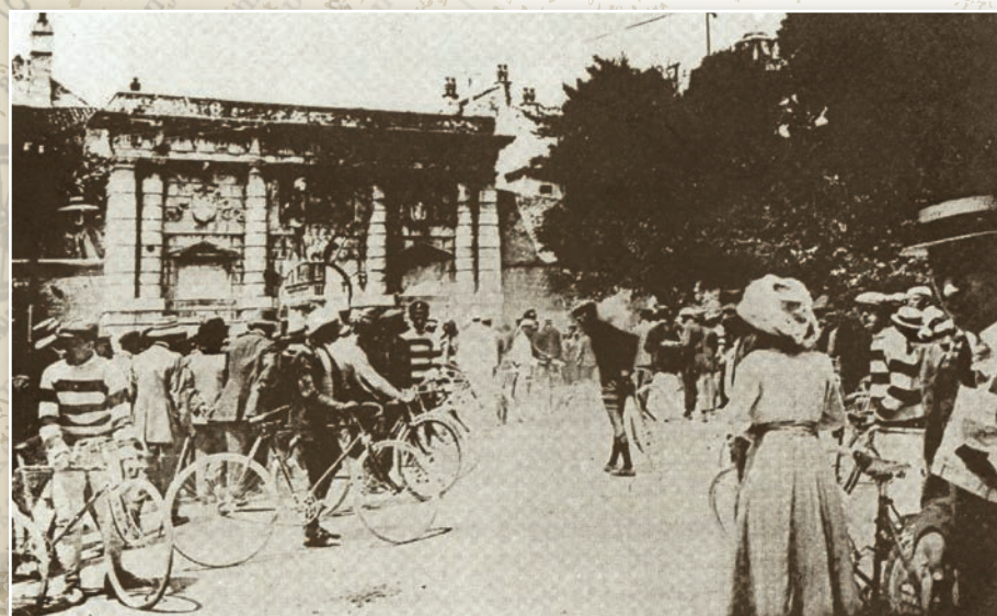
Biciklisti u Foši pred utrką za prvenstvo Dalmacije, 29. 6. 1914.