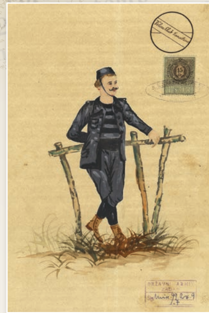
Odora biciklista Veloce Club Zaratino, 1893. g.

domoljubima iz susjednih mjesta. Tako je 18. kolovoza 1897. četrnaest članova Hrvatskog sokola na „koturačama“ tj. biciklima išlo u Sinj na alku.