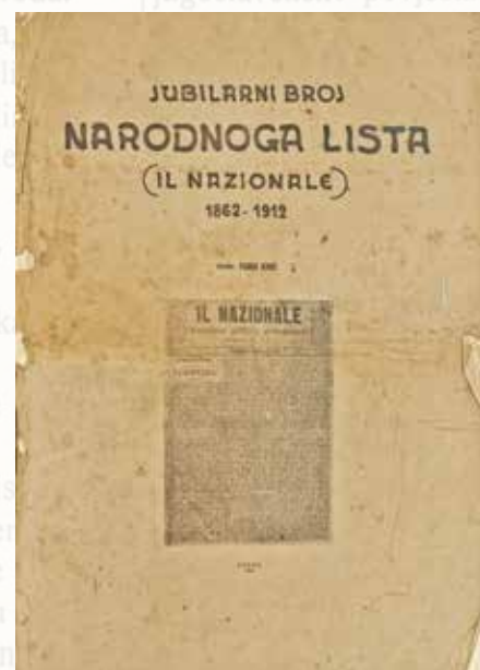
Jubilarni broj Narodnoga lista (Il Nazionale) 1862. - 1912., Zadar 1912.