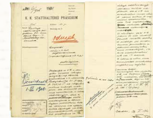
Spis o dodjeli odlikovanja povodom 80. imendana cara i kralja Franje Josipa I. - poziv za predlaganje osoba istaknutih u dobrotvornom radu, 1910.