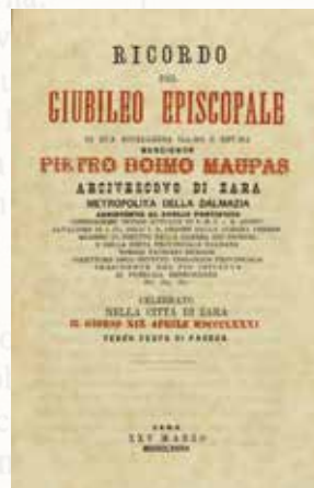
Knjižica u sjećanje na biskupski jubilej zadarskoga nadbiskupa i metropolita Dalmacije Petra Dujma Maupasa, 1882.

Svečano izdanje pjesme u čast maestra Antonija Ravasija za njegovu 25. godišnjicu boravka i djelovanja u Zadru tiskano je na svili 1883. godine, a 20. godišnjicu djelovanja sonetom je obilježilo i Tipografsko društvo u Zadru.