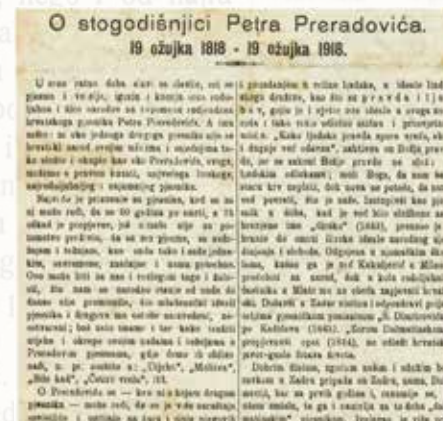
„O stogodišnjici Petra Preradovića“, dio članka, Narodni list, br. 20, 20. ožujka 1918.