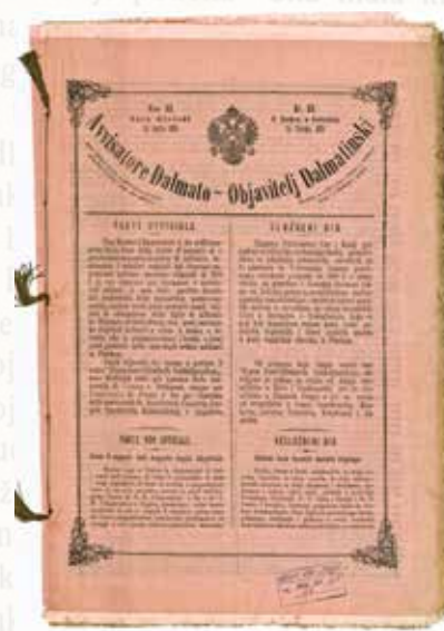
Avvisatore Dalmato - Objavitelj Dalmatinski, br. 33, 24. travnja 1879.

Narodni list , najstarije hrvatske novine koje i danas djeluju, obilježile su 1912. godine 50. obljetnicu utemeljenja i izlazenja. Tom prigodom izdan je Jubilarni broj Narodnoga lista (Il Nazionale) 1862.-1912 . Tiskan u svečanom ruhu, na 116 stranica donio je pregled događanja koja su obilježila politički i kulturni razvitak Dalmacije u proteklom pedesetogodišnjem razdoblju.