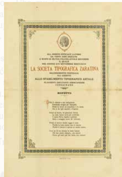
Sonet povodom proslave 20. godišnjice osnutka Zadarskoga tipografskog društva, 1894.

Prigodna knjižica objavljena je 1882. u sjećanje na biskupski jubilej zadarskoga nadbiskupa i metropolita Dalmacije Petra Dujma Maupasa, dok prilog službenom listu Zadarske nadbiskupije 1886. godine donosi čestitke pape Leona XIII., cara i kralja Franje Josipa I. kao i mnoge druge, u povodu proslave 50. obljetnice svećeničkog ređenja nadbiskupa Maupasa.