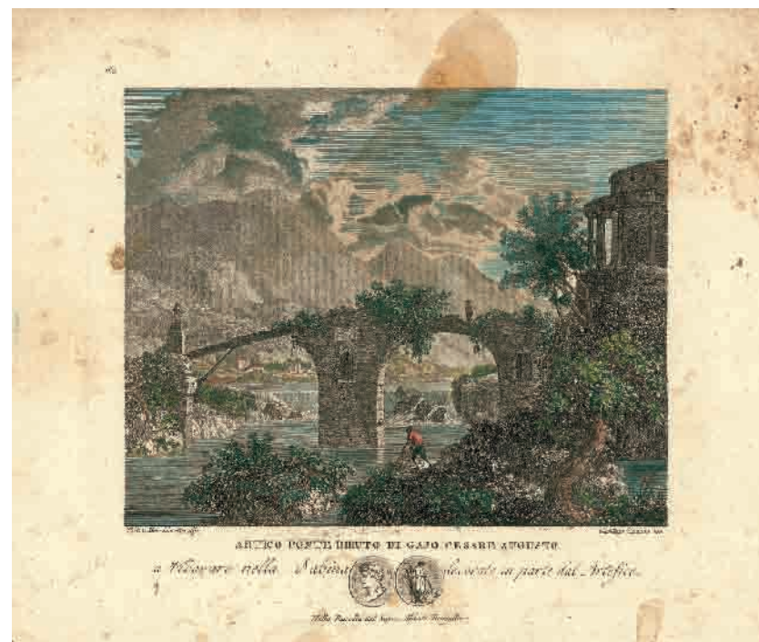
Kataloški broj 27

HR-DAZD-383-Kartografska zbirka, br. 211