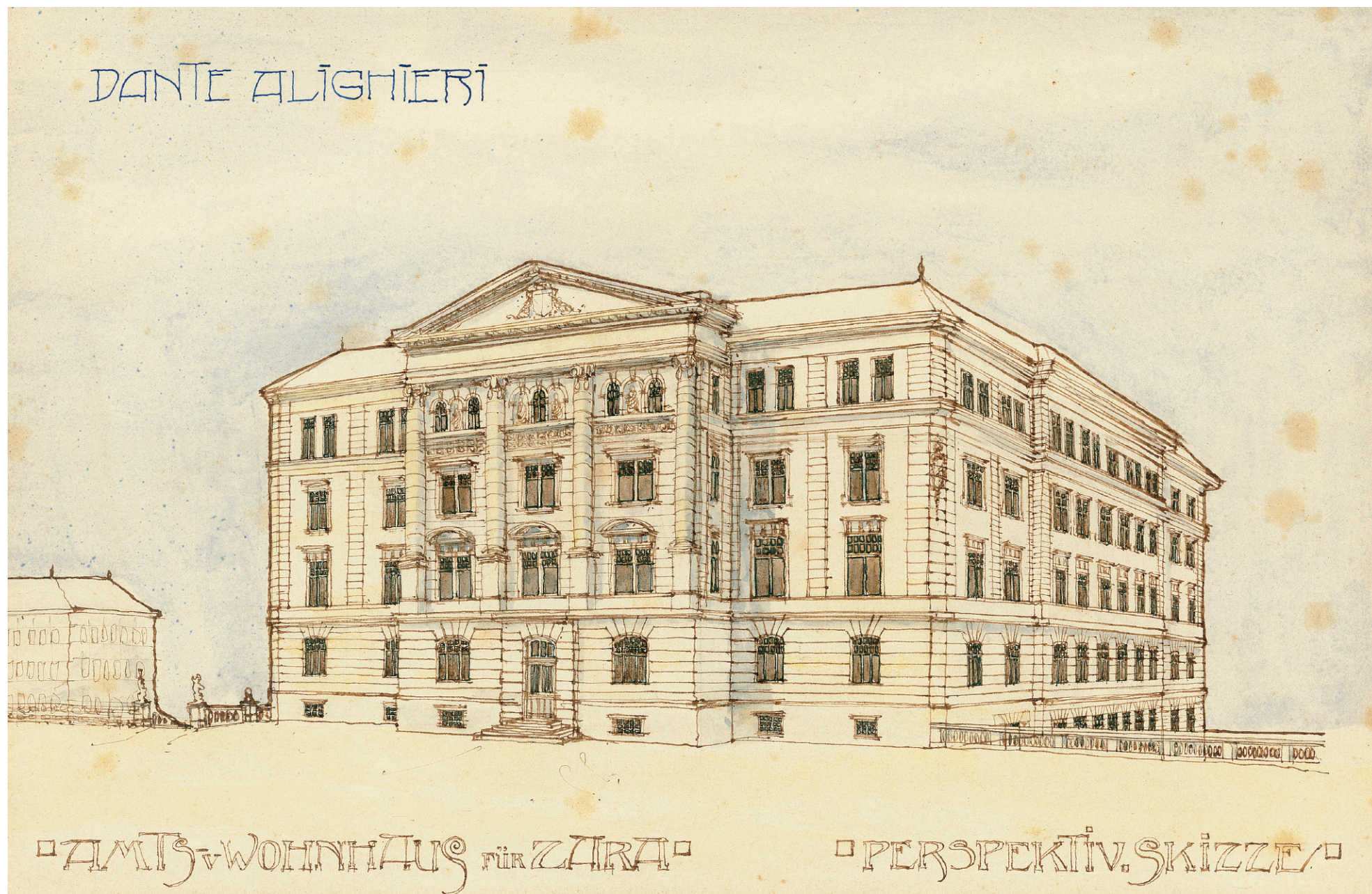
Kataloški broj 39

HR-DAZD-383-Kartografska zbirka, br. 220