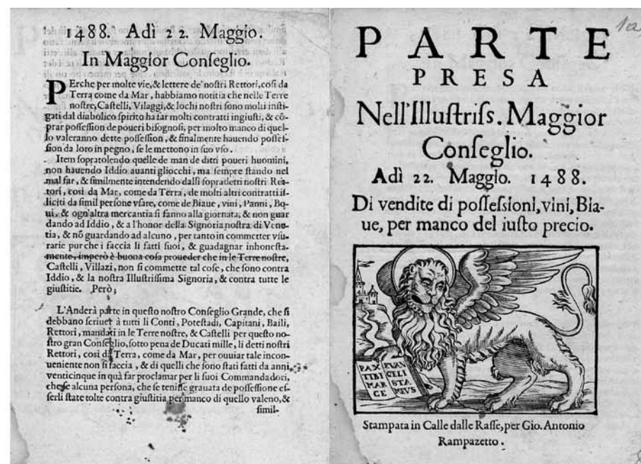
Kat. br. 1 Zaključak mletačkog Velikog vijeća iz 1488.